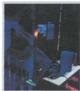
Ressuage réalisé avec un outillage breveté ECOTDS sans soudure et boulonnage, la lecture n'est pas du tout perturbée par des taches fluo.