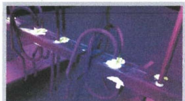
Ressuage réalisé avec un outillage classique contenant des soudures, la lecture est perturbée par les taches fluo.